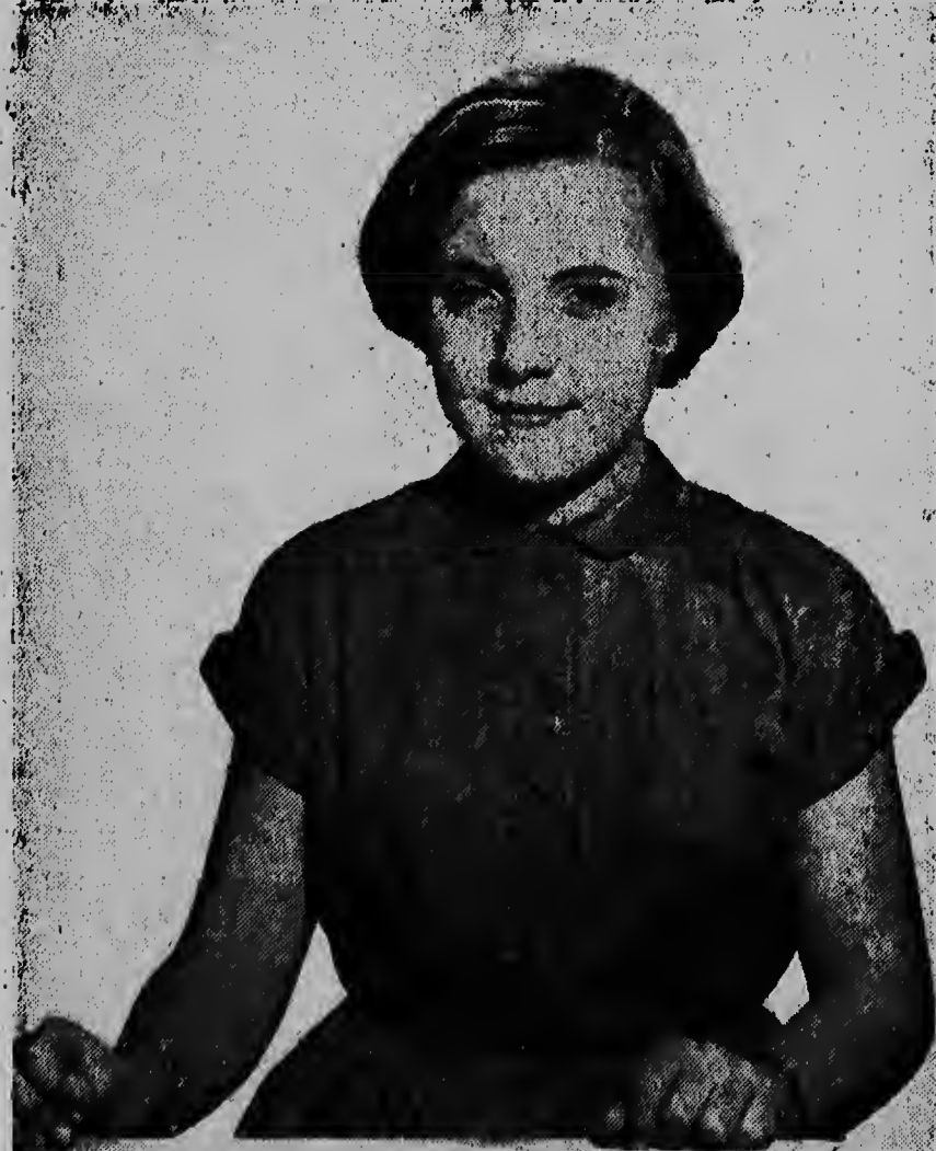
Heden heeft Prinses Margriet de dertienjarige leeftijd bereikt. Een verjaardagsviering op Soestdijk, die zeker de prinses een prettige dag zal bezorgen. Wij bieden Prinses Margriet, Haar Koninklijke Ouders en Zusters onze eerbiedige gelukwensen aan.